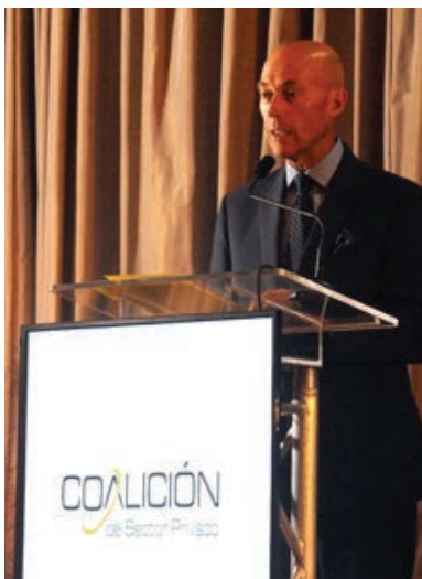
El Excongresista Jerry Weller explica lo que se puede esperar del proceso en los próximos meses.